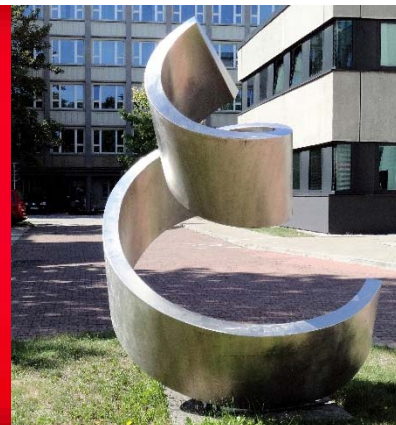
Skulptur vor dem Technikum Analytikum